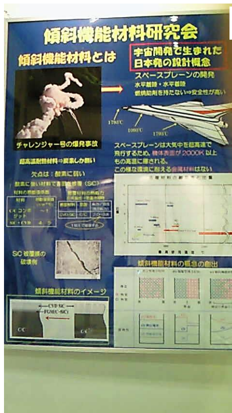
▼日刊工業新聞社「工業材料」・ 「型技術」誌と FGMS 研究会資料