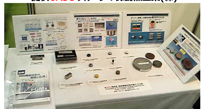
▲ SPS 法により作製した傾斜機能材料(FGMs) サンプルコーナー