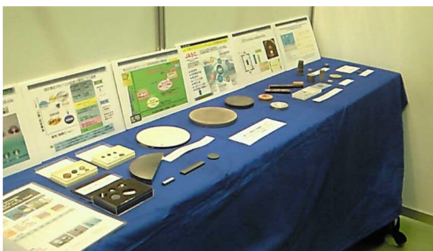
▲ SPS 法により作製したセラミックス・金属・ 複合材料の代表サンプルコーナー