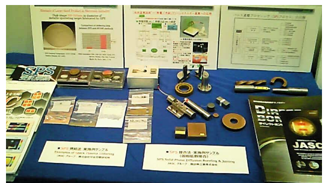
▲ SPS 接合法により作製した固相拡散接合サンプル例